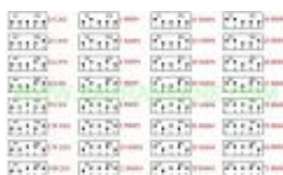
Таблица с положенията на клетките за определяне на времето за разбъркване от 1,5 сек. до 1,5 часа.

Таблица с положенията на клетките за определяне на времето за разбъркване от 1,5 часа до 24 часа.