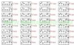
Таблица с положенията на клетките за определяне на времето за разбъркване от 1,5 часа до 24 часа.