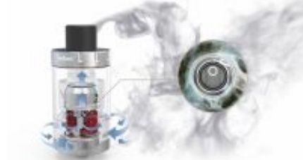
RTA Coil is exposed in the air-flow channel, all vapor can be taken out completely.