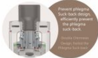
Prevent phlegma Suck-back design, efficiently prevent the phlegma suck-back.