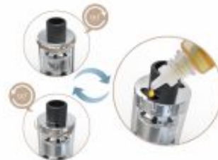
Unique and Convenient Top Filling