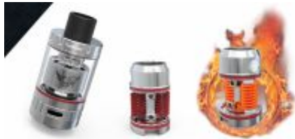
Vertical RTA Coil DIY Structure