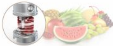
Because of the Vertical Coil Design, the phlegma can backflow to the Juice-intake System and prevent the splash of Juice, provide you the most genuine original taste at the same time.