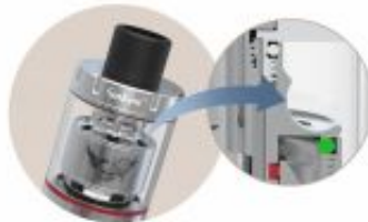
Recommended Use Power : 30-80W