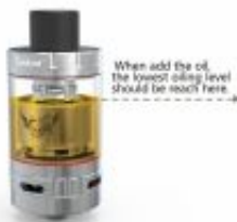
When add the oil, the lowest oiling level should be reach here.